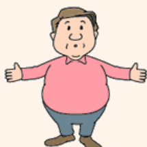
高血圧や糖尿病、肥満などの生活習慣病やメタボリックシンドロームがある