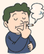
たばこを吸っている