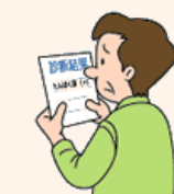
検診などでたんぱく尿が見つかったことがある