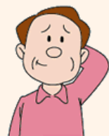
家族に腎臓病の人がいる