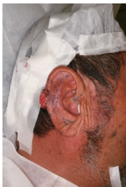
右耳介有棘細胞癌