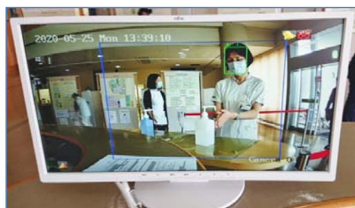
人工知能 自動顔認証・体温検知画面